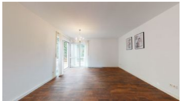
Teilansicht Zimmer 1