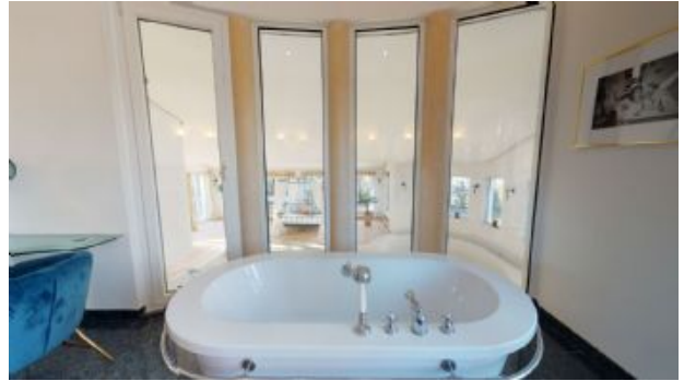
Blick in das Hallenbad