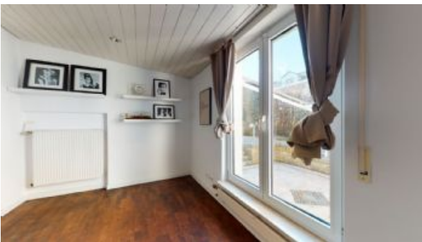
Teilansicht Zimmer 3