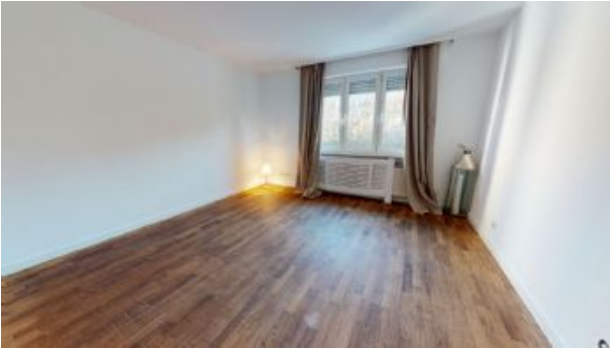
Teilansicht Zimmer 2