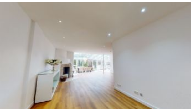
Blick in den Wohnbereich