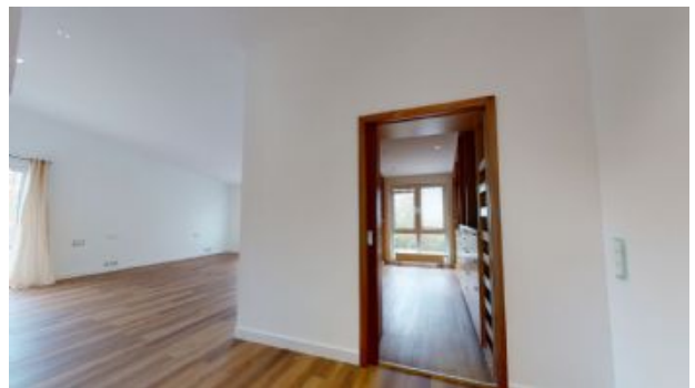
Blick zum Ankleideraum